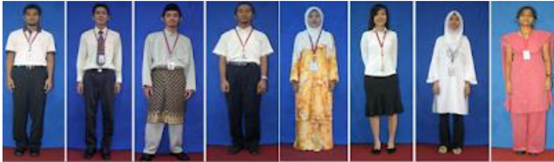
Contoh Pakaian Mahasiswa/i